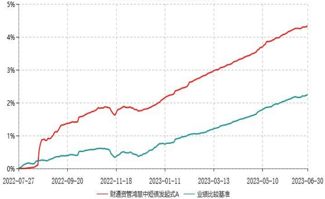
财通资管鸿慧中短债发起式C累计净值增长率与业绩比较基准收益率历史走势对比图