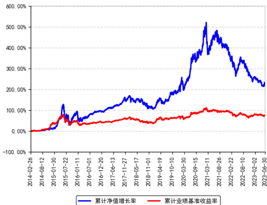
南方新优享灵活配置混合A累计净值增长率与同期业绩比较基准收益率的历史走势对比图