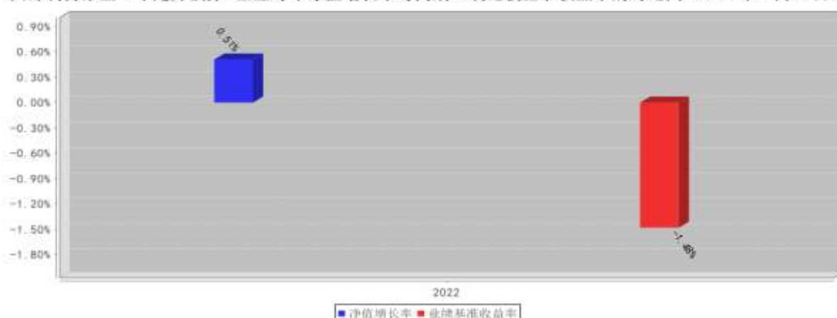
西部利得聚盈一年定开债券A基金每年净值增长率与同期业绩比较基准收益率的对比图（2022年12月31日）