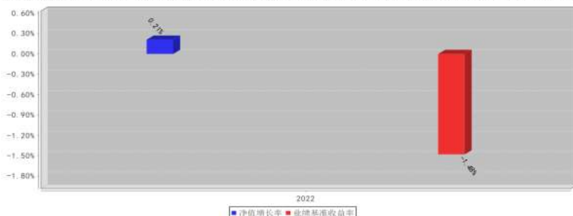
西部利得聚盈一年定开债券C基金每年净值增长率与同期业绩比较基准收益率的对比图（2022年12月31日）