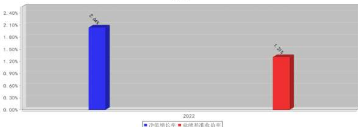
西部利得季季稳90天滚动持有债券C基金每年净值增长率与同期业绩比较基准收益率的对比图（2022年12月31日）