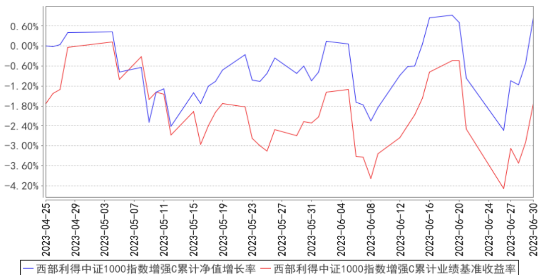
西部利得中证1000指数增强C累计净值增长率与同期业绩比较基准收益率的历史走势对比图