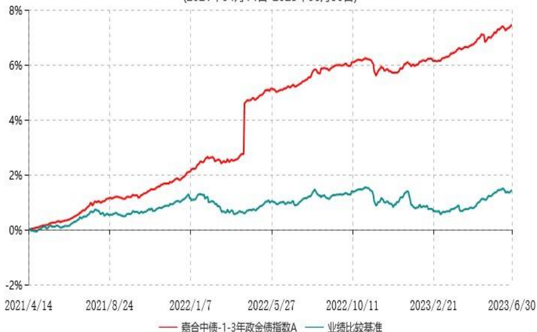
嘉合中债-1-3年政金债指数A累计净值增长率与业绩比较基准收益率历史走势对比图 (2021年04月14日-2023年06月30日)