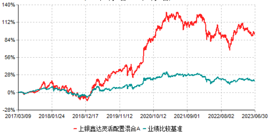
上银鑫达灵活配置混合A累计净值增长率与业绩比较基准收益率历史走势对比图 (2017年03月09日-2023年06月30日)