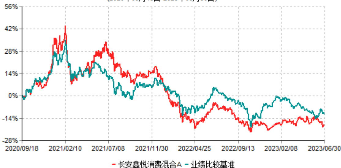
长安鑫悦消费混合A累计净值增长率与业绩比较基准收益率历史走势对比图 (2020年09月18日-2023年06月30日)

根据基金合同的规定,自基金合同生效之日起6个月内基金各项资产配置比例需符合基金合同要求。本基金在建仓期结束后,各项资产配置比例已符合基金合同有关投资比例的约定。本基金于2020年9月18日成立,基金合同生效日至报告期末,本基金运作时间已满一年。图示日期为2020年9月18日至2023年6月30日止。