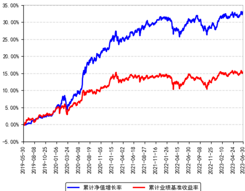
南方致远混合A累计净值增长率与同期业绩比较基准收益率的历史走势对比图