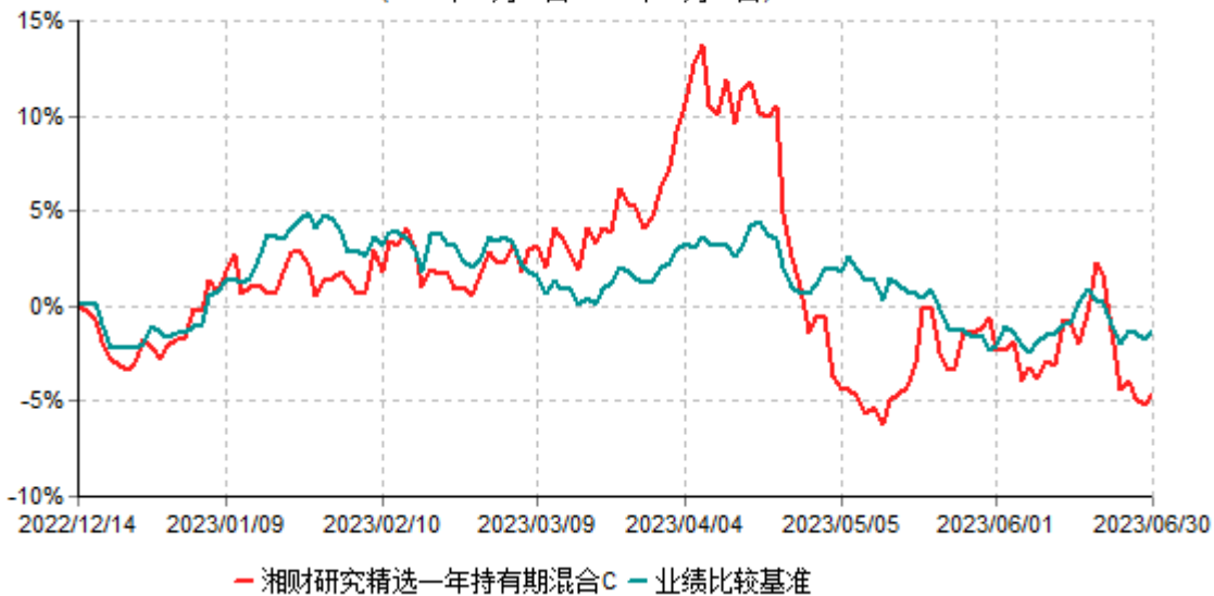
湘财研究精选一年持有期混合C累计净值增长率与业绩比较基准收益率历史走势对比图 (2022年12月14日-2023年06月30日)