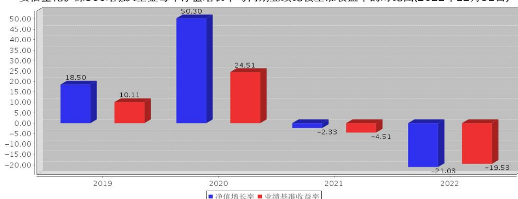
安信量化沪深300增强A基金每年净值增长率与同期业绩比较基准收益率的对比图(2022年12月31日)

注:基金合同生效当年期间的相关数据按实际存续期计算。基金的过往业绩并不代表其未来表现。