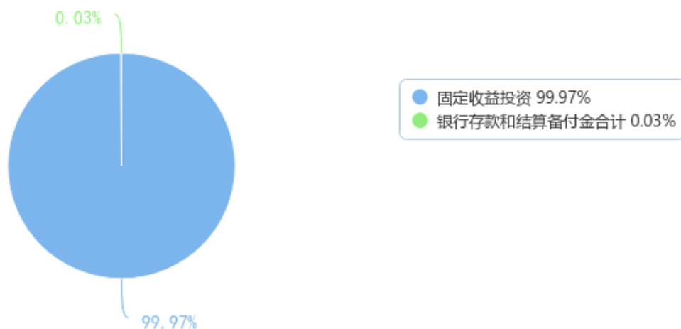
投资组合资产配置图表（数据截至日期：2023年06月30日）