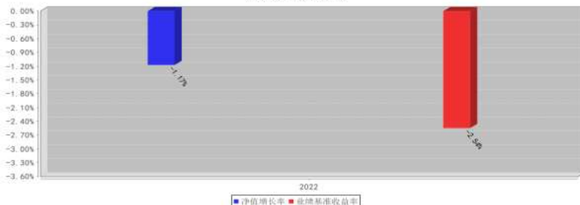
兴证全球优选平衡三个月持有混合（FOF）C基金每年净值增长率与同期业绩比较基准收益率的对比图 （2022年12月31日）

注：1、本基金于2022年9月5日公告增设C类基金份额，C类份额的2022年数据统计期间为2022年9月5日至2022年12月31日，数据按实际存续期计算，不按整个自然年度进行折算。