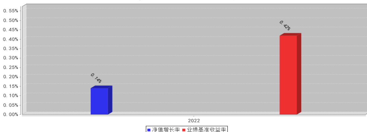
民生加银月月乐 30 天持有期短债 A 基金每年净值增长率与同期业绩比较基准收益率的对比图 (2022 年 12 月 31 日)

注：1. 基金合同生效当年/基金份额增设当年的相关数据按实际存续期计算，不按整个自然年度进行折算。 2. 基金过往业绩不代表未来表现。