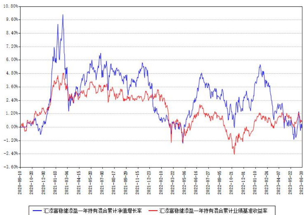
汇添富稳健添盈一年持有混合累计净值增长率与同期业绩基准收益率对比图