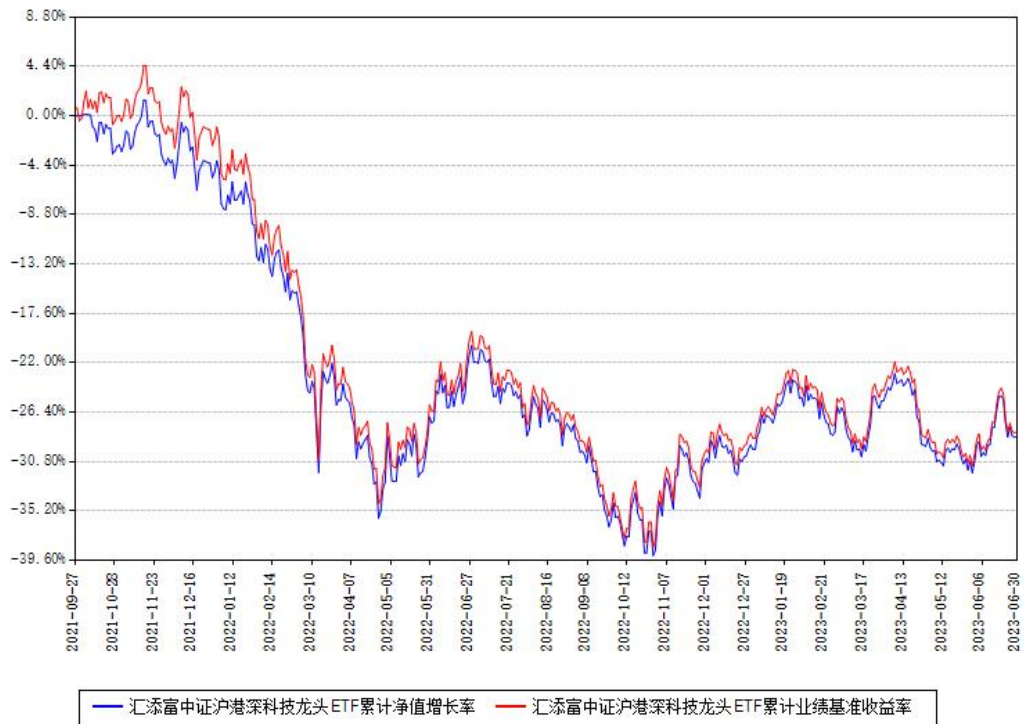
汇添富中证沪港深科技龙头ETF累计净值增长率与同期业绩基准收益率对比图