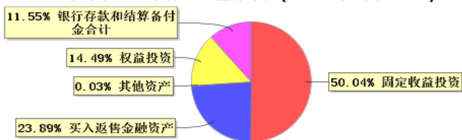
投资组合资产配置图表(2023年6月30日)

● 固定收益投资 ● 买入返售金融资产 ● 其他资产 ● 权益投资 ● 银行存款和结算备付金合计