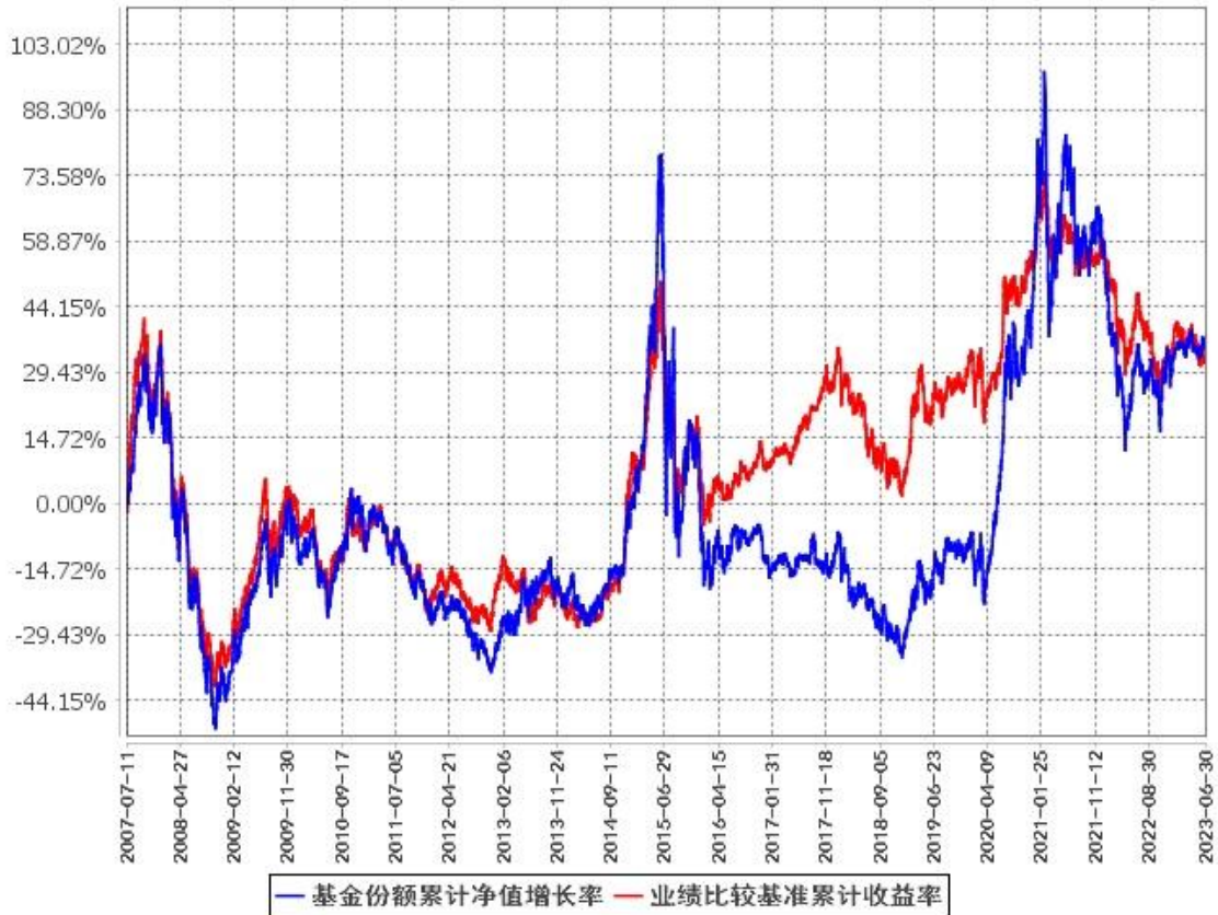
基金份额累计净值增长率与同期业绩比较基准收益率的历史走势对比图 (2007年7月11日至2023年6月30日)

注：1、按照本基金的基金合同约定，本基金自 2007 年 7 月 11 日合同生效之日起六个月内使基金的投资组合比例符合基金合同的约定。