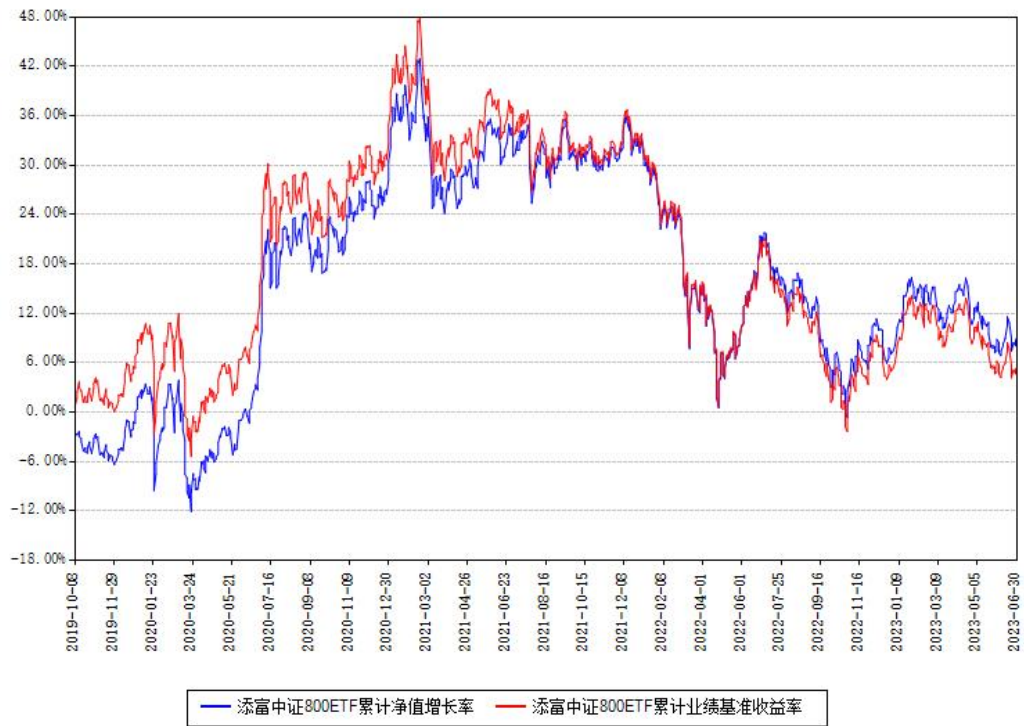
添富中证800ETF累计净值增长率与同期业绩基准收益率对比图