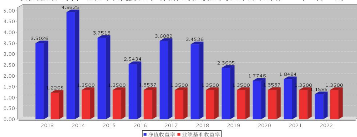
安信现金管理货币A基金每年净值收益率与同期业绩比较基准收益率的对比图(2022年12月31日)

注:基金合同生效当年期间的相关数据按实际存续期计算。基金的过往业绩并不代表其未来表现。