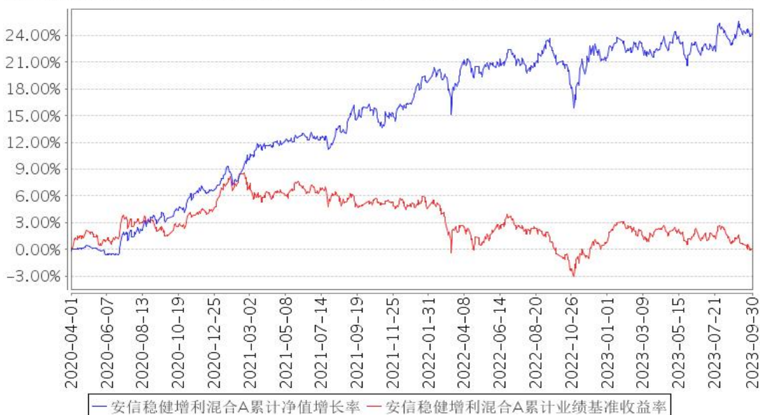
安信稳健增利混合A累计净值增长率与同期业绩比较基准收益率的历史走势对比图