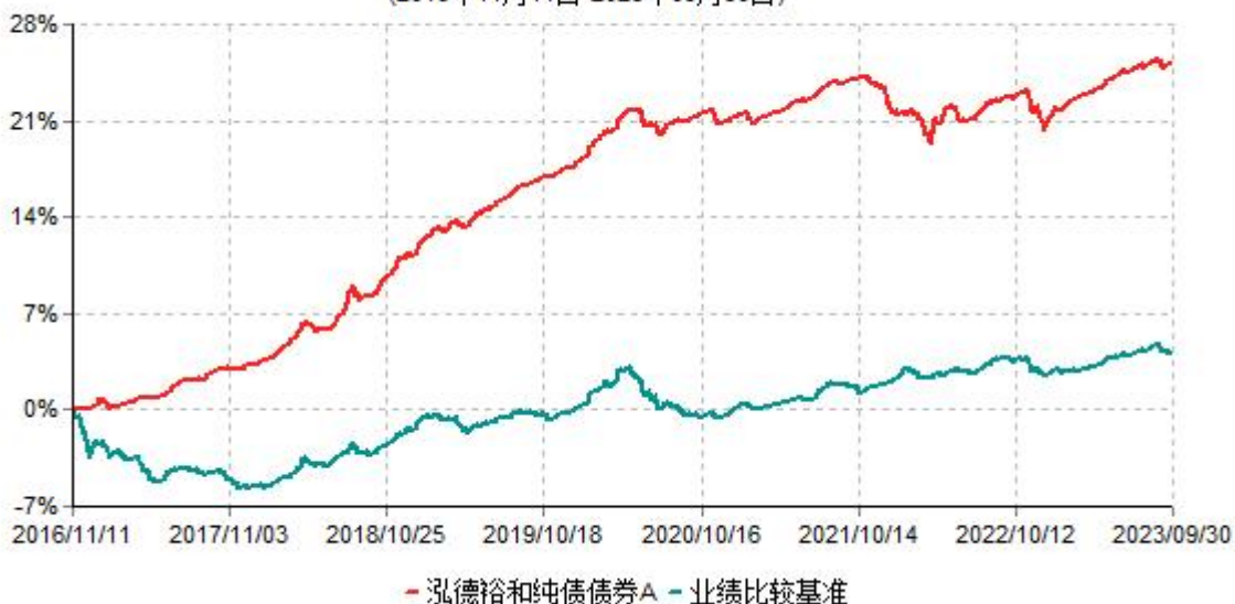
泓德裕和纯债债券A累计净值增长率与业绩比较基准收益率历史走势对比图 (2016年11月11日-2023年09月30日)