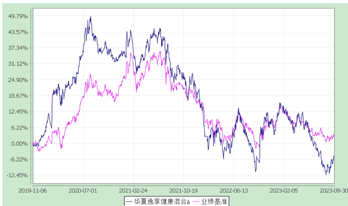
华夏逸享健康混合 C: