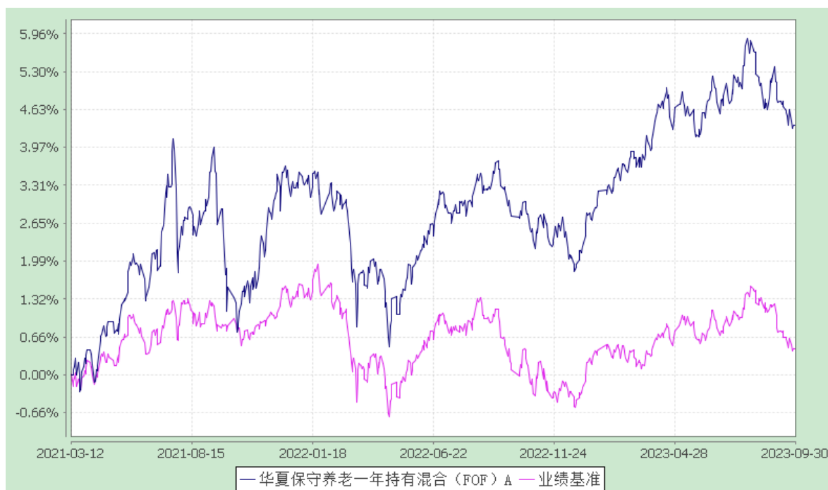
华夏保守养老一年持有混合（FOF）Y：