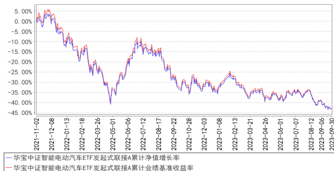
华宝中证智能电动汽车ETF发起式联接A累计净值增长率与同期业绩比较基准收益率的历史走势对比图