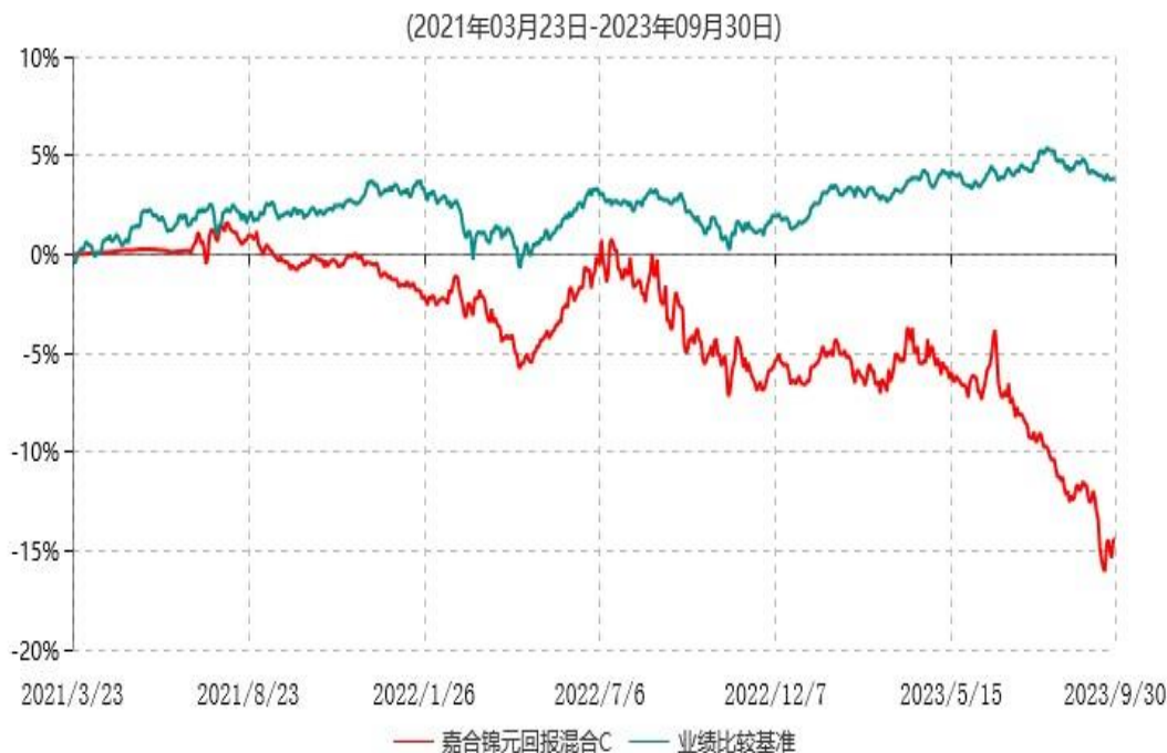
嘉合锦元回报混合C累计净值增长率与业绩比较基准收益率历史走势对比图