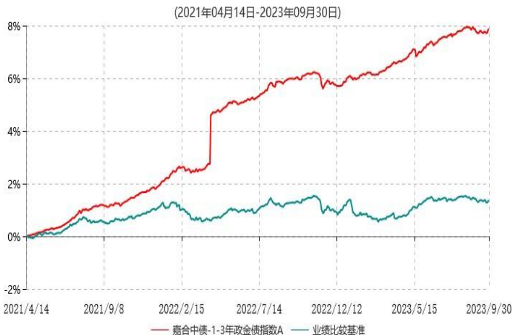
嘉合中债-1-3年政金债指数A累计净值增长率与业绩比较基准收益率历史走势对比图