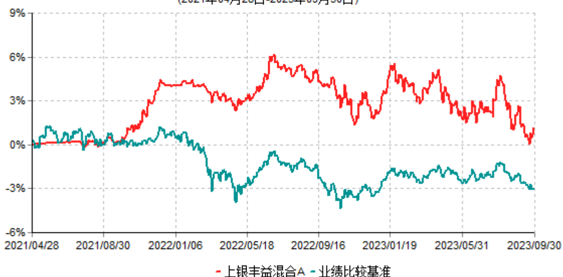
上银丰益混合A累计净值增长率与业绩比较基准收益率历史走势对比图 (2021年04月28日-2023年09月30日)