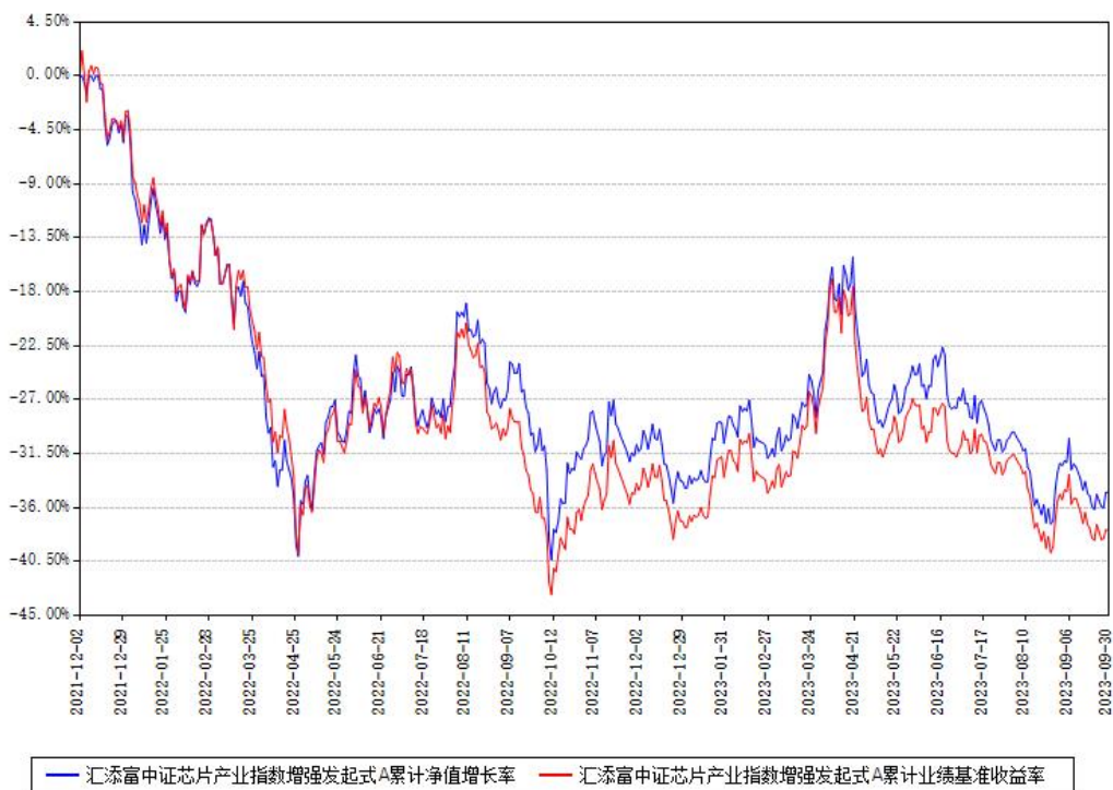
汇添富中证芯片产业指数增强发起式A累计净值增长率与同期业绩基准收益率对比图