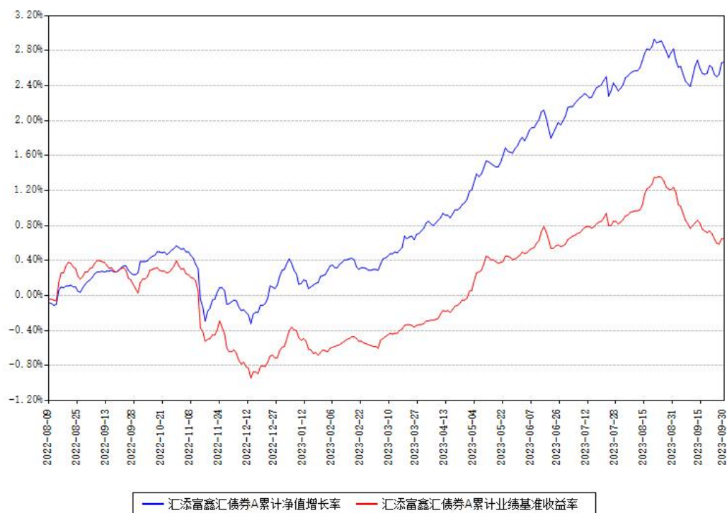
汇添富鑫汇债券A累计净值增长率与同期业绩基准收益率对比图