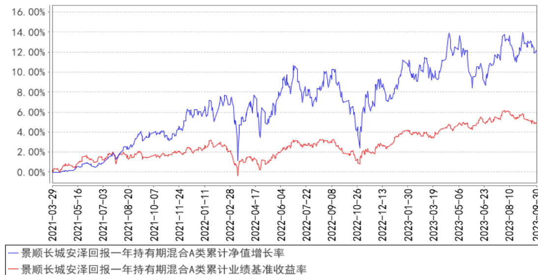
景顺长城安泽回报一年持有期混合A类累计净值增长率与同期业绩比较基准收益率的历史走势对比图