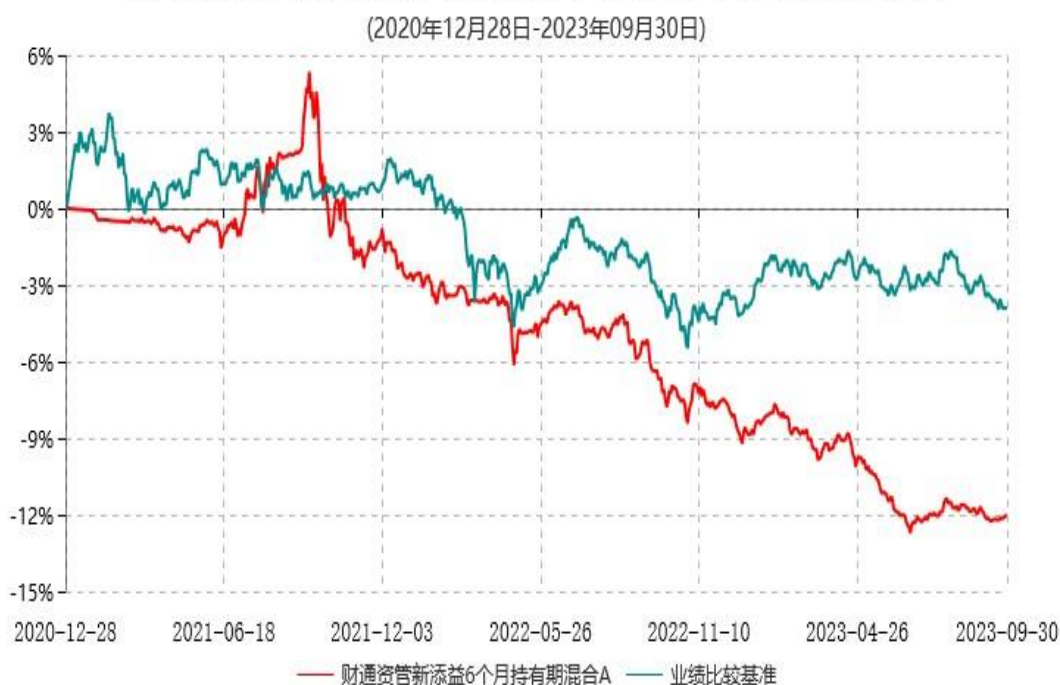
财通资管新添益6个月持有期混合A累计净值增长率与业绩比较基准收益率历史走势对比图