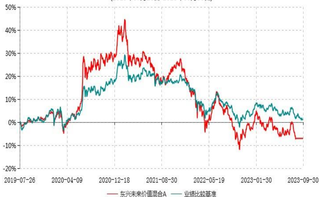
东兴未来价值混合A累计净值增长率与业绩比较基准收益率历史走势对比图 (2019年07月26日-2023年09月30日)