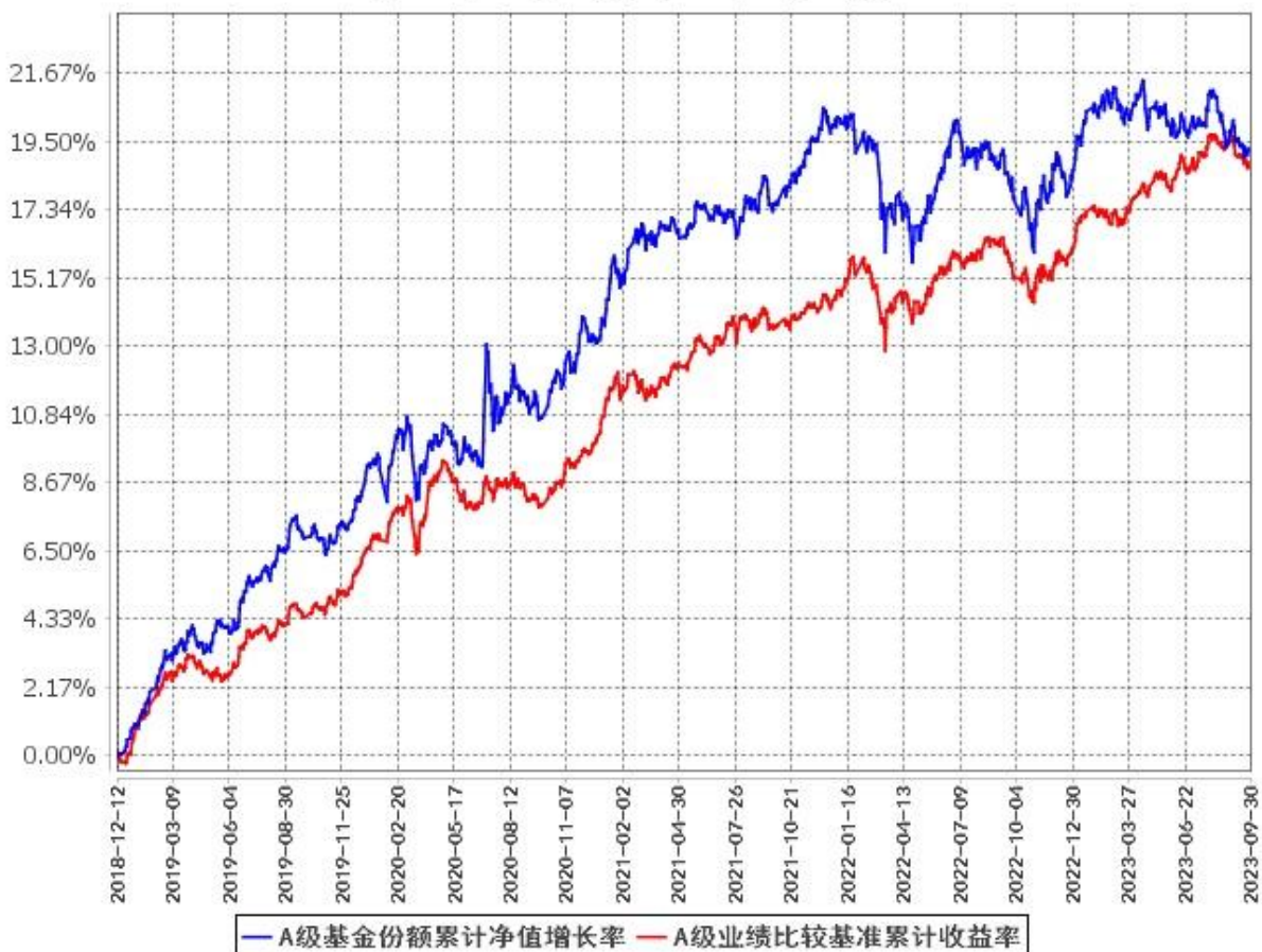
A级基金份额累计净值增长率与同期业绩比较基准收益率的历史走势对比图 (2018年12月12日至2023年9月30日)