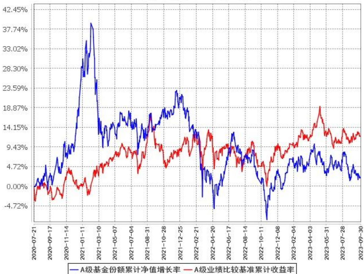
A级基金份额累计净值增长率与同期业绩比较基准收益率的历史走势对比图 (2020年7月21日至2023年9月30日)