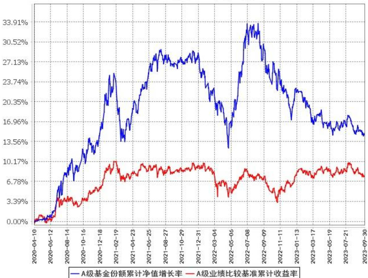
A级基金份额累计净值增长率与同期业绩比较基准收益率的历史走势对比图 (2020年4月10日至2023年9月30日)