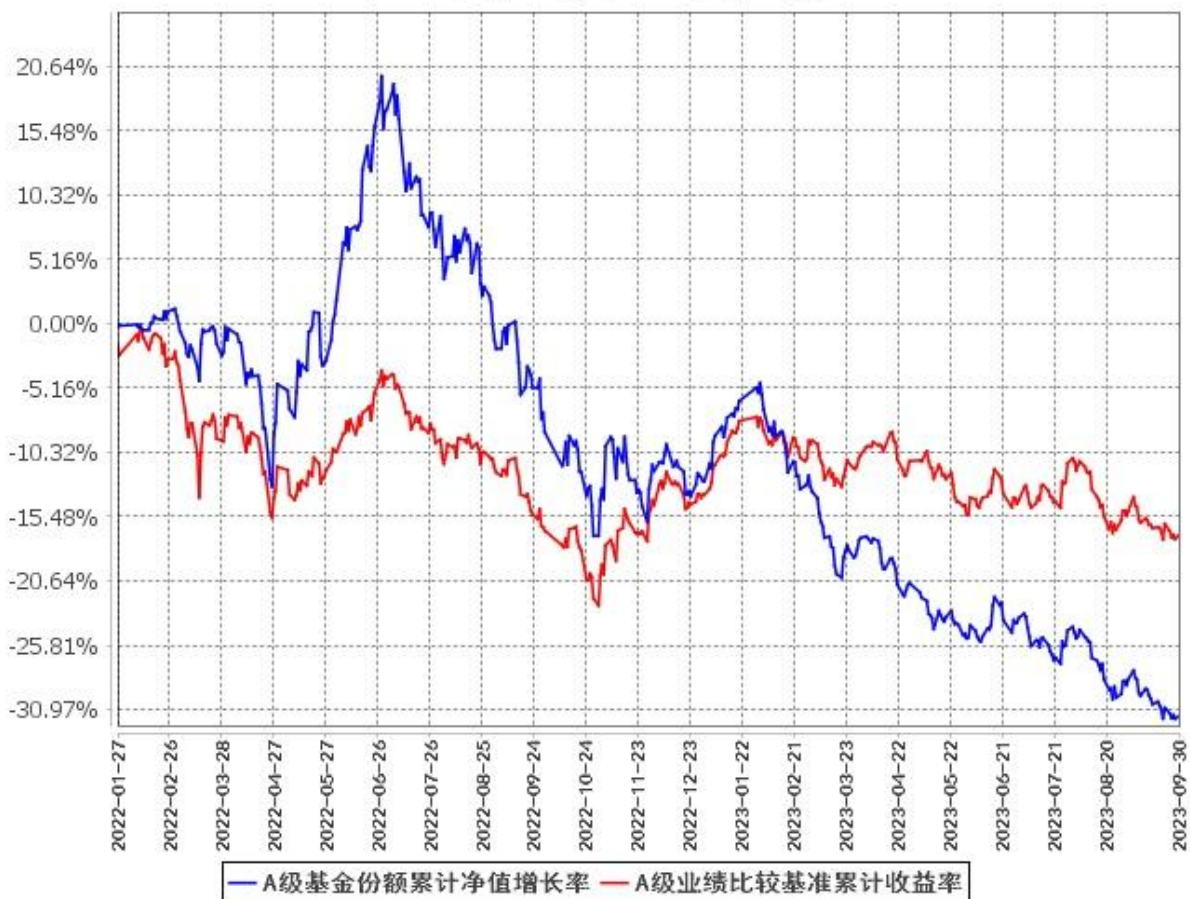
A级基金份额累计净值增长率与同期业绩比较基准收益率的历史走势对比图 (2022年1月27日至2023年9月30日)