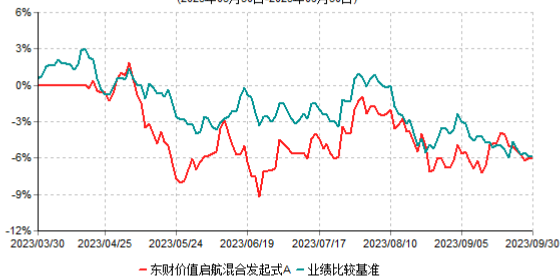
东财价值启航混合发起式A累计净值增长率与业绩比较基准收益率历史走势对比图 (2023年03月30日-2023年09月30日)