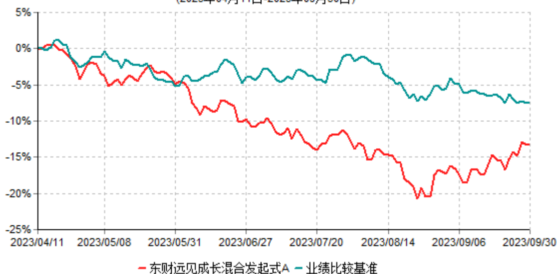
东财远见成长混合发起式A累计净值增长率与业绩比较基准收益率历史走势对比图 (2023年04月11日-2023年09月30日)