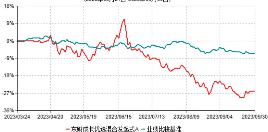
东财成长优选混合发起式A累计净值增长率与业绩比较基准收益率历史走势对比图 (2023年03月24日-2023年09月30日)