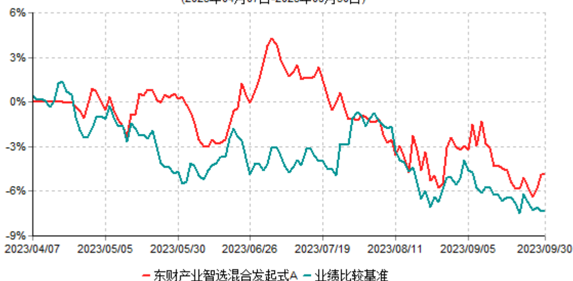
东财产业智选混合发起式A累计净值增长率与业绩比较基准收益率历史走势对比图 (2023年04月07日-2023年09月30日)