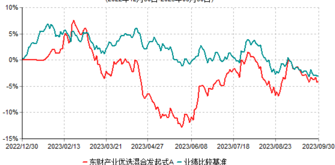
东财产业优选混合发起式A累计净值增长率与业绩比较基准收益率历史走势对比图 (2022年12月30日-2023年09月30日)