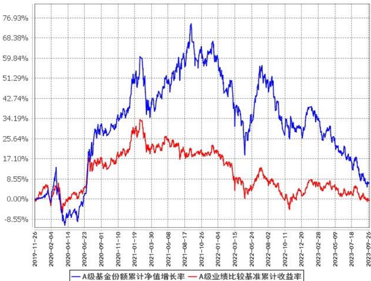
A级基金份额累计净值增长率与同期业绩比较基准收益率的历史走势对比图 (2019年11月26日至2023年9月30日)