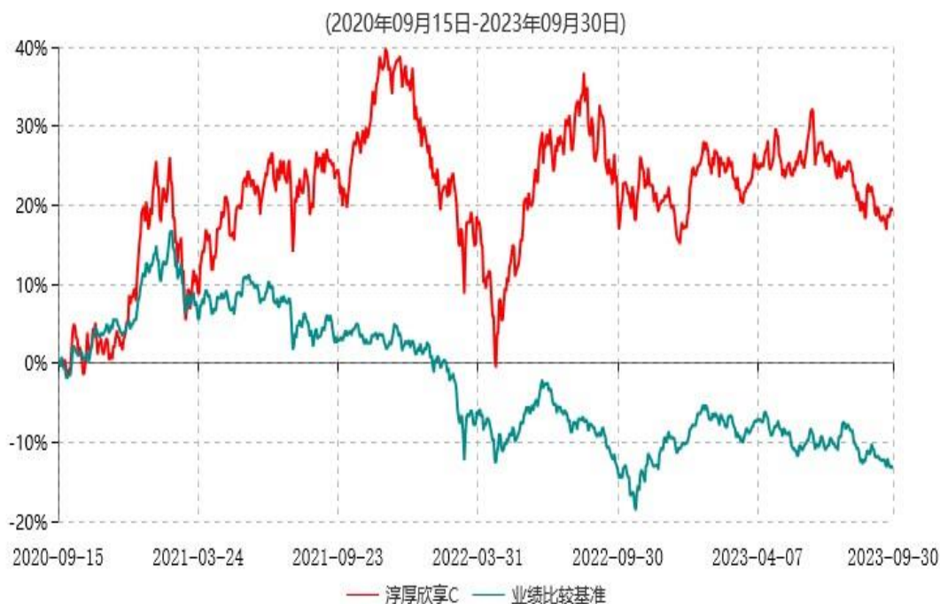
淳厚欣享C累计净值增长率与业绩比较基准收益率历史走势对比图

注：本基金基金合同生效日为 2020 年 9 月 15 日。按基金合同规定，本基金自基金合同生效起 6 个月内为建仓期。建仓期结束时本基金的各项投资比例均符合基金合同约定。