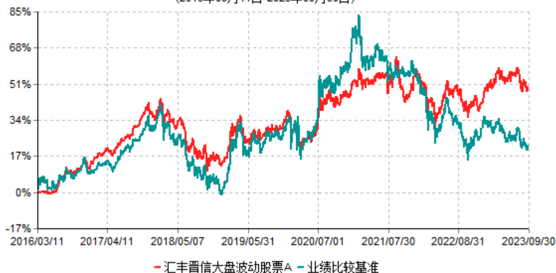
汇丰晋信大盘波动股票A累计净值增长率与业绩比较基准收益率历史走势对比图 (2016年03月11日-2023年09月30日)