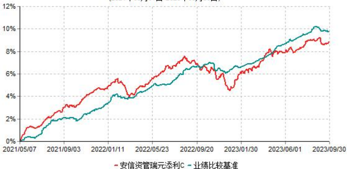
安信资管瑞元添利C累计净值增长率与业绩比较基准收益率历史走势对比图 (2021年05月07日-2023年09月30日)

注：安信资管瑞元添利 C（970031）5 月 6 日尚未开放申赎，无计划份额，2021 年 5 月 6 日净值不进行披露。