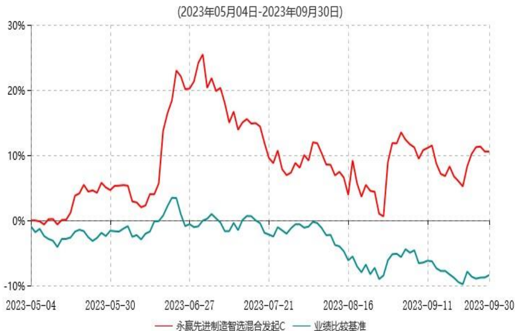
永赢先进制造智选混合发起C累计净值增长率与业绩比较基准收益率历史走势对比图

注：1、本基金合同生效日为 2023 年 05 月 04 日，截至本报告期末本基金合同生效未满一年； 2、本基金建仓期为本基金合同生效日起六个月，截至本报告期末，本基金尚处于建仓期中。