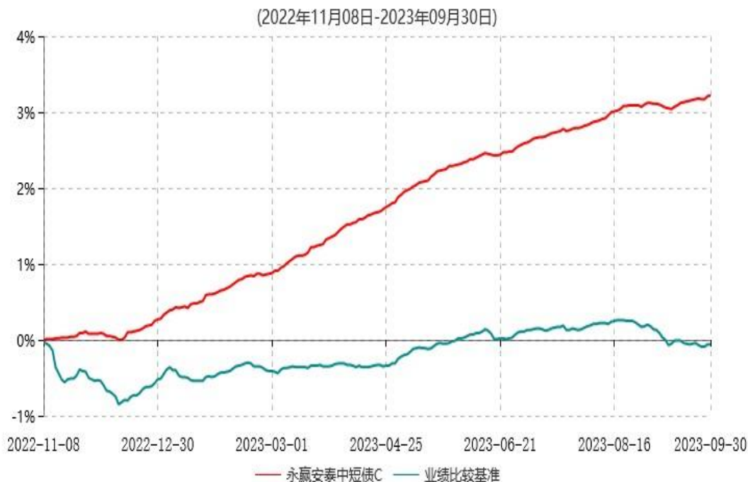
永赢安泰中短债C累计净值增长率与业绩比较基准收益率历史走势对比图

注：1、本基金合同生效日为 2022 年 11 月 08 日，截至本报告期末本基金合同生效未满一年；