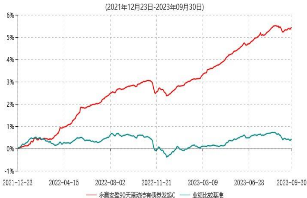
永赢安盈90天滚动持有债券发起C累计净值增长率与业绩比较基准收益率历史走势对比图